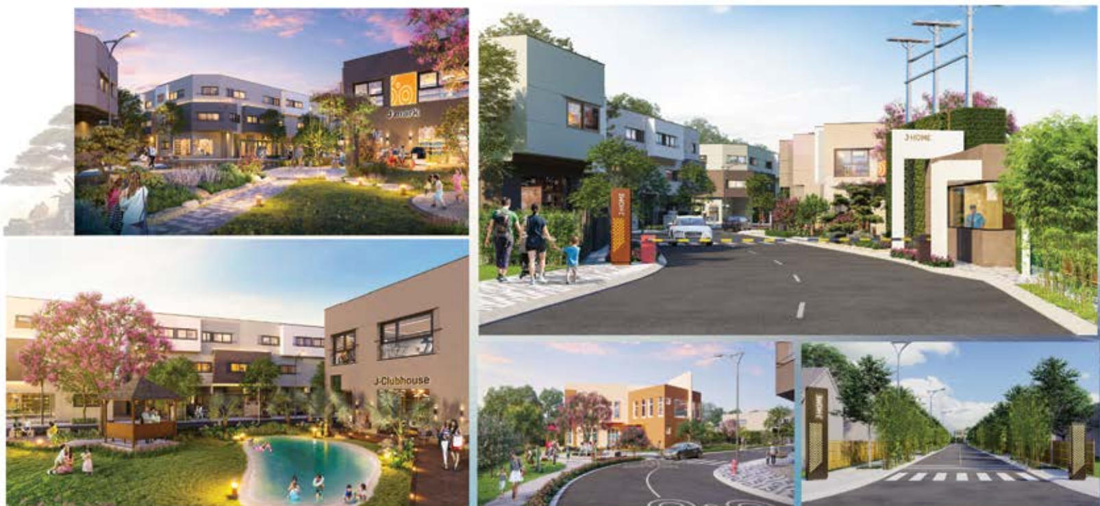
Thông tin và hình ảnh trong tài liệu chỉ mang tính chất tham khảo tại thời điểm phát hành. Thông tin chính thức chỉ có trên hợp đồng ký kết

Giữa lòng đô thị công nghiệp sôi động bậc nhất phía Nam, Cát Tường J-Home trở thành biểu tượng sống sang trọng, thanh tao mang đậm dấu ấn Nhật. Nơi thiên nhiên và kiến trúc cùng hòa quyện, tôn tạo nên chất sống thời thượng, biệt lập nhưng gắn kết, tinh gọn nhưng đủ đầy.