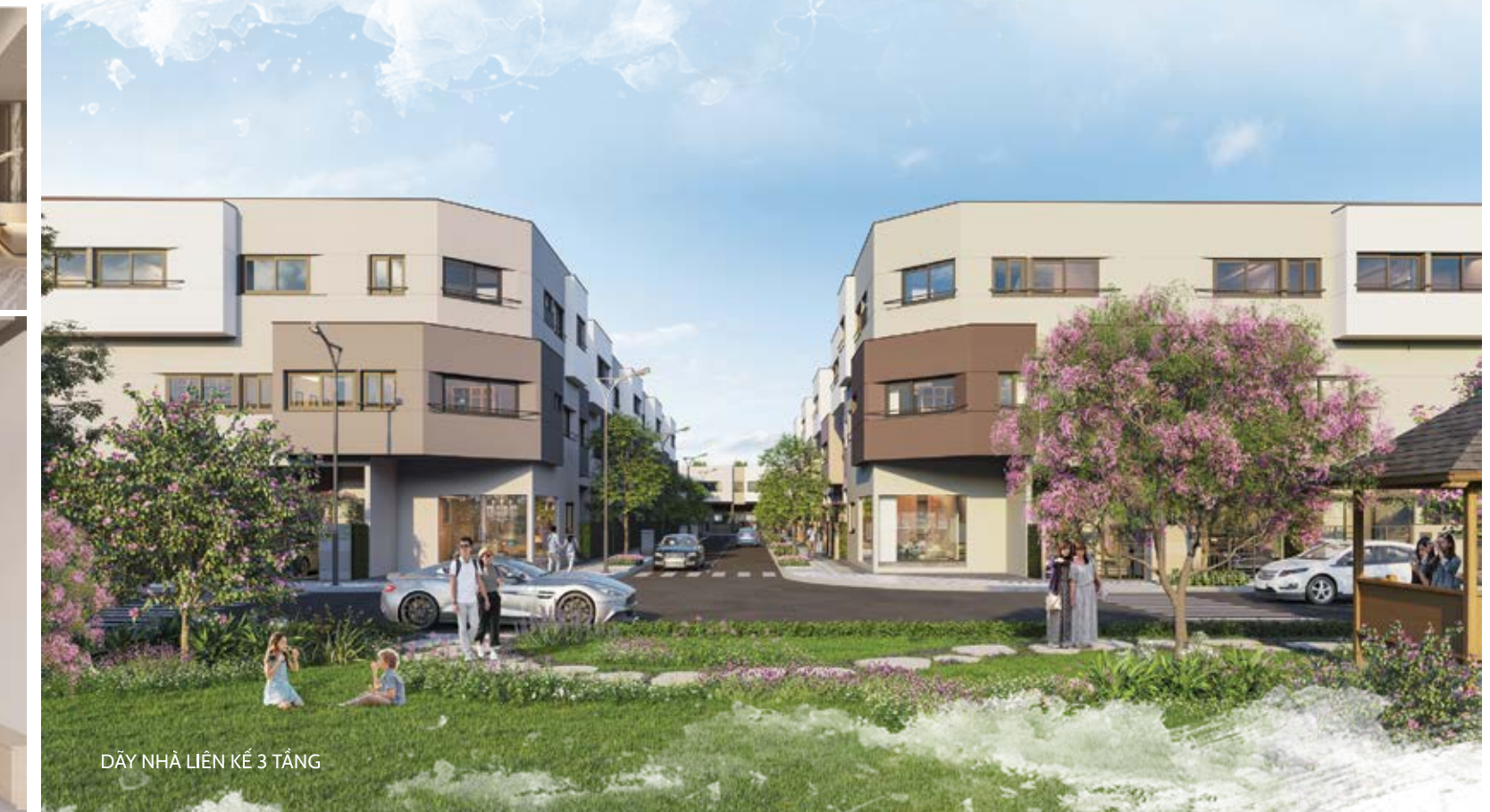
DÂY NHÀ LIÊN KẾ 3 TẦNG

Thông tin và hình ảnh trong tài liệu chỉ mang tính chất tham khảo tại thời điểm phát hành. Thông tin chính thức căn cứ trên hợp đồng ký kết.