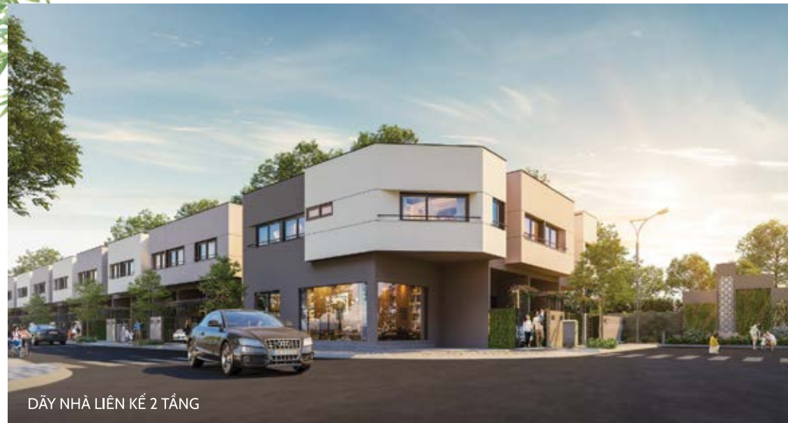
DÂY NHÀ LIÊN KẾ 2 TẦNG

Thông tin và hình ảnh trong tài liệu chỉ mang tính chất tham khảo tại thời điểm phát hành. Thông tin chính thức căn cứ trên hợp đồng ký kết.