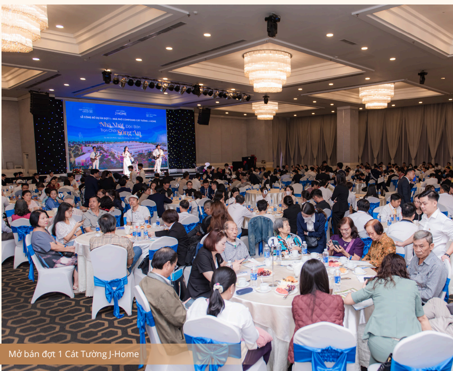
Mở bán đợt 1 Cát Tường J-Home

Chính sự ra mắt mỹ mãn này đã giúp vực dậy niềm tin, niềm hy vọng cho không chỉ riêng đội ngũ kinh doanh mà còn tiếp thêm lửa cho toàn thể anh chị em CBNV của Tập đoàn.