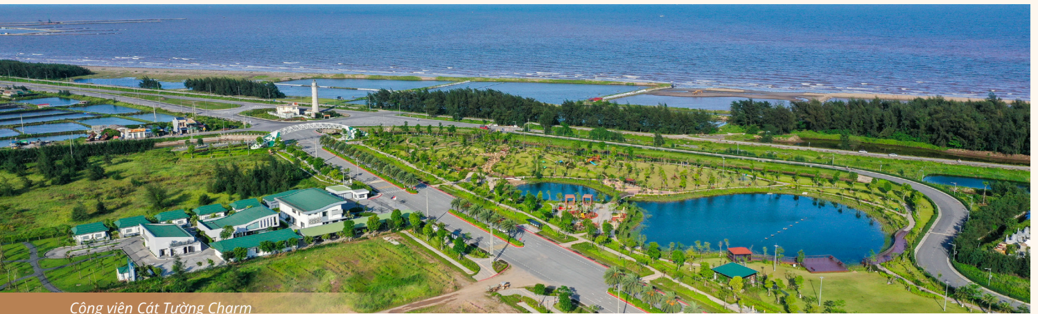
Công viên Cát Tường Charm

Công viên Cát Tường Charm (KCN Aurora IP) được khai trương và đưa vào vận hành từ đầu năm 2024 không chỉ mang đến cho người dân địa phương một không gian xanh, thoáng đãng giúp tái tạo năng lượng, nơi mọi người ở mọi lứa tuổi có thể rèn luyện thể chất mà còn là một điểm đến “xanh” mang dấu ấn riêng của Cát Tường Group tại vùng đất Nghĩa Hưng, Nam Định.